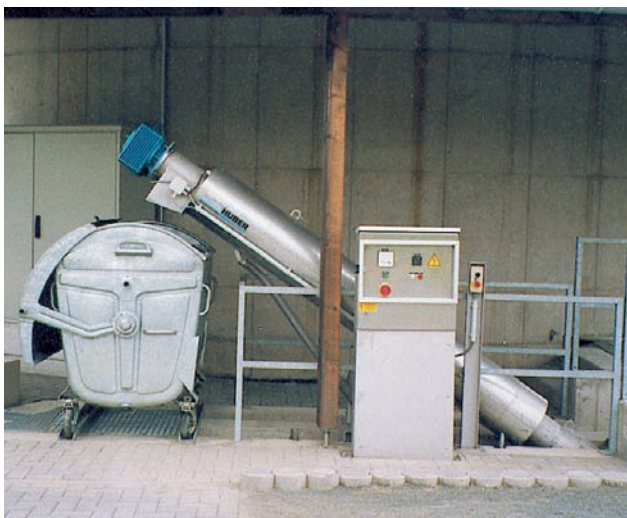
Instalación estándar de un ROTAMAT® Micro Strainer