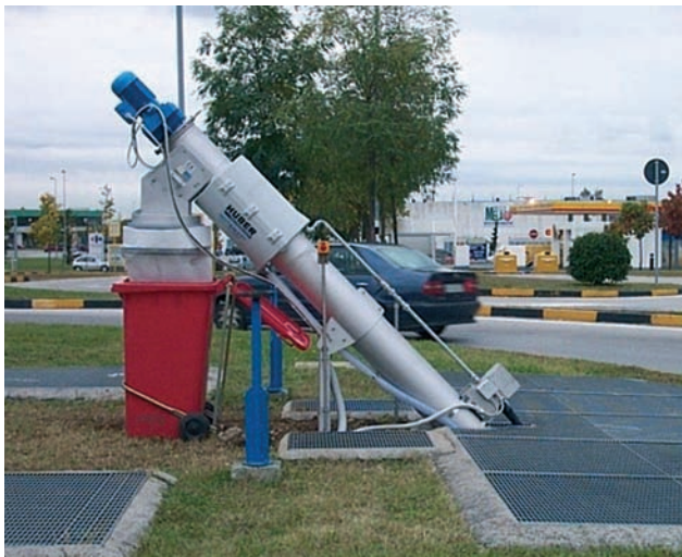
ROTAMAT® Micro Strainer instalado en medio de una rotonda