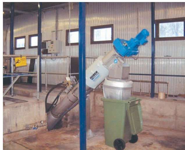
ROTAMAT® Micro Strainer tamaño 700 instalado en canal