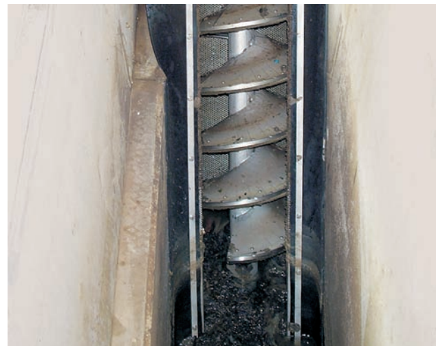
ROTAMAT® Micro Strainer Ro 9 XL con cojinete cerámico