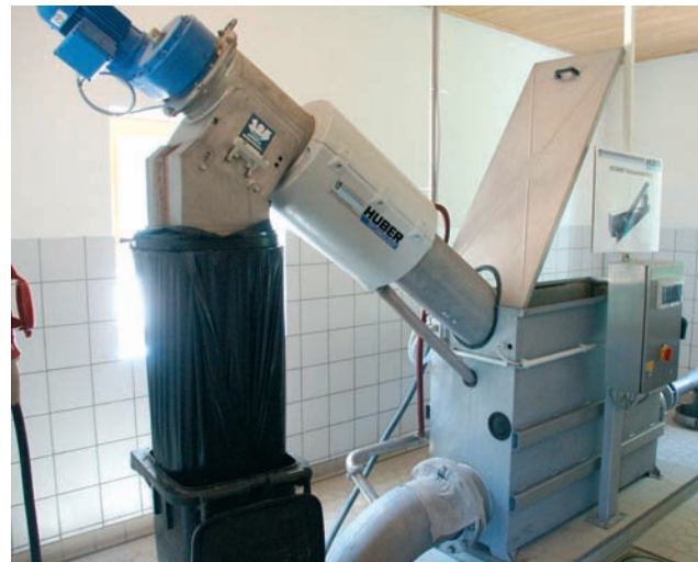
ROTAMAT® Micro Strainer instalado en contenedor