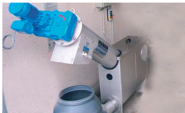
ROTAMAT® Micro Strainer Ro 9 Ec montado en contenedor