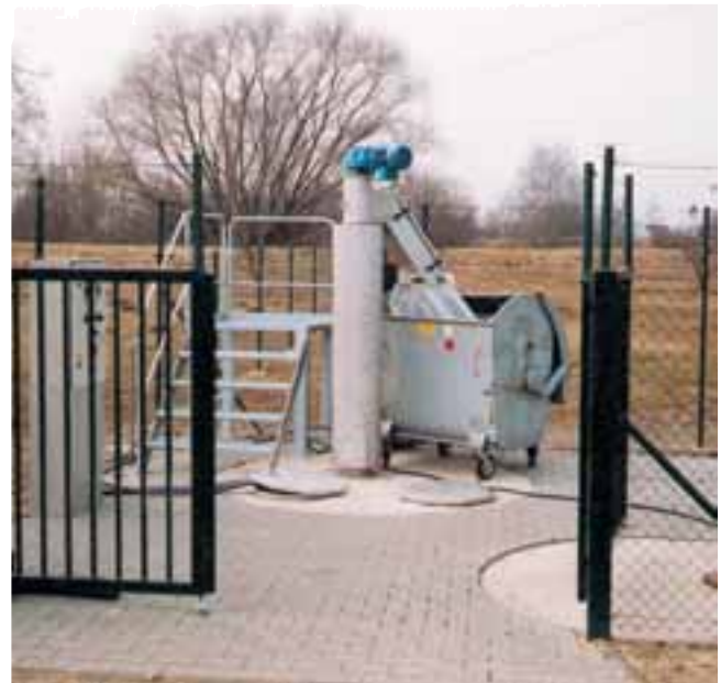
Versión con aislamiento para instalación exterior